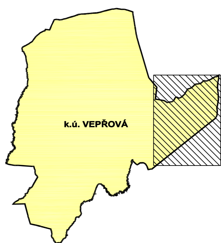
VYZNAČENÍ VÝŘEZU VE VZTAHU K ŘEŠENÉMU ÚZEMÍ